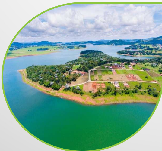
Condomínio Palmas do Paiol