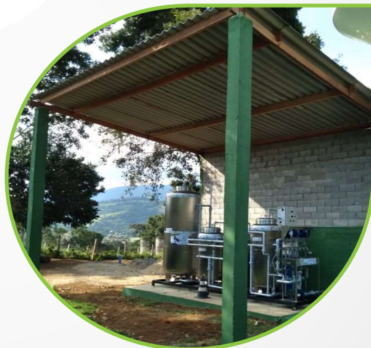
Estação Compacta Instalada