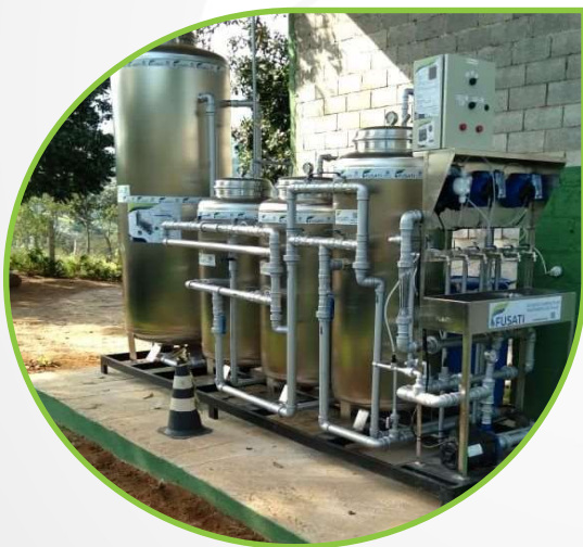
Estação Compacta Instalada

Instalação da Estação Compacta de Tratamento de Água com Floccodecantador FUSATI